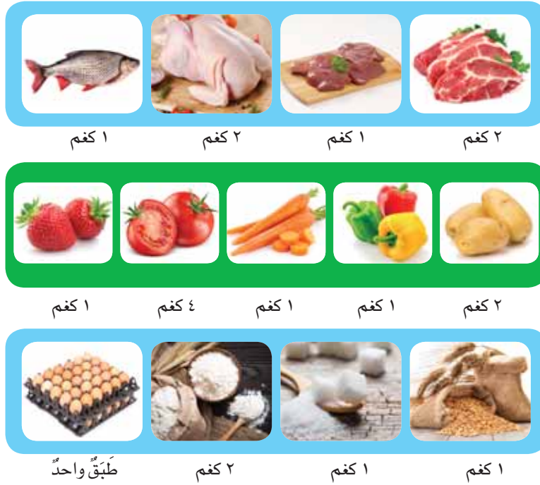
الشكل (٢-١): قائمة السلع المطلوبة