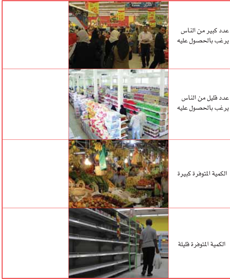
الجدول (٢-١): جدول العرض والطلب